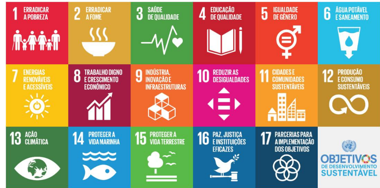
Objetivos de Desenvolvimento Sustentável (Organização das Nações Unidas, 2015)

Os ODS têm como principal objetivo acabar com a pobreza, promover a prosperidade e o bem-estar, proteger o ambiente e combater os efeitos das alterações climáticas.